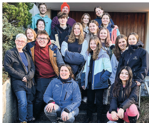
Sportbegeisterte am Snow-Weekend